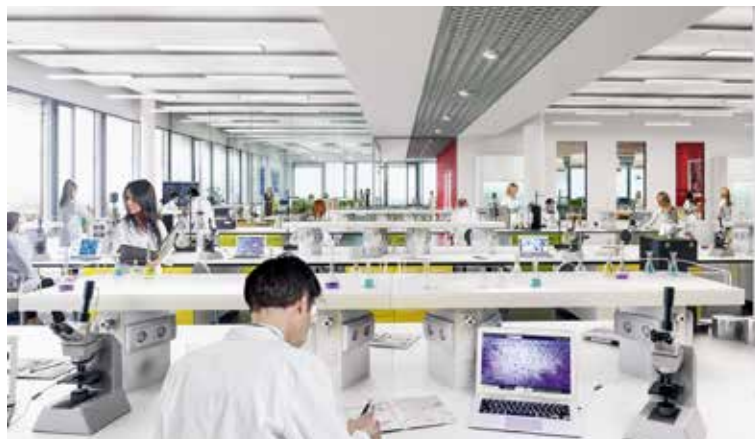
EXEMPLE : LABORATOIRE

De grands plateaux lumineux, agrémentés de patios intérieurs et de finitions soignées, apportent un aspect qualitatif représentant un environnement idéal pour les activités tertiaires et industrielles à forte valeur ajoutée.