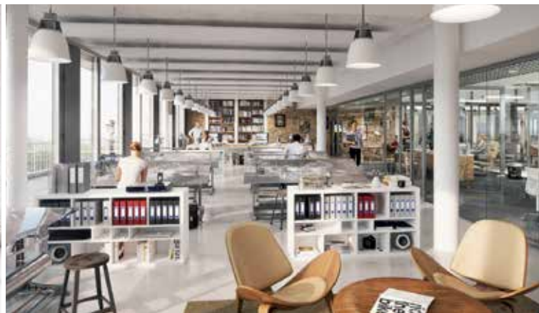
EXEMPLE : BUREAU D'ÉTUDES